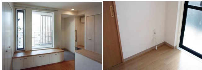
例：段差解消に配慮した玄関、居室への緊急通報設置