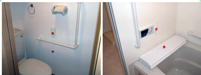
例：緊急通報と手すりを設置したトイレ、浴室