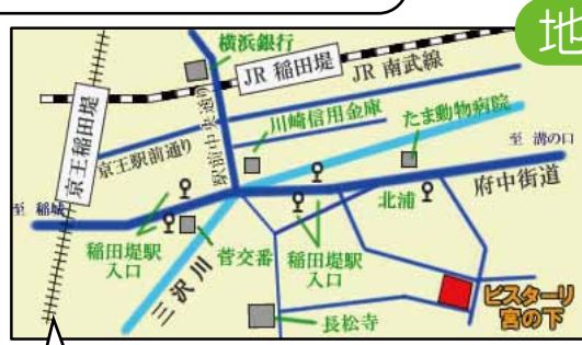
近隣に「コンビニエンスストア」「農産物直売所」「スポーツセンター」があります。