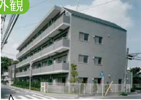
バルコニーは南東に面していて日当たり良好です♪